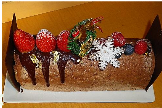
② ノエル バローナチョコムースとマンゴープリン

マスカルポーネムースの中に、フランボワーズと チョコレートガナッシュをサンドし、外側は水玉模様のビ スキュイ (ジェノワーズ、フランボワーズ、チョコガナッシュ、マス カルムース、ビスキュイジョコンド)