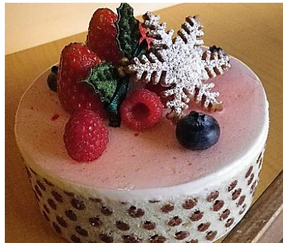
③ ベリーとマスカルポーネ