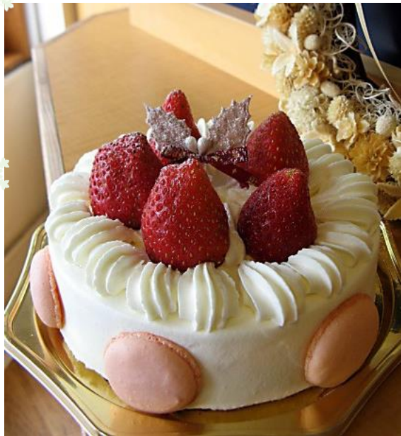
① クリスマスケーキ シャンティフレーズ

①クリスマスケーキ シャンティフレーズ 4号12cm 2~3名 ¥2,600 5号15cm 4~6名 ¥3,450 6号からのご注文も承ります。